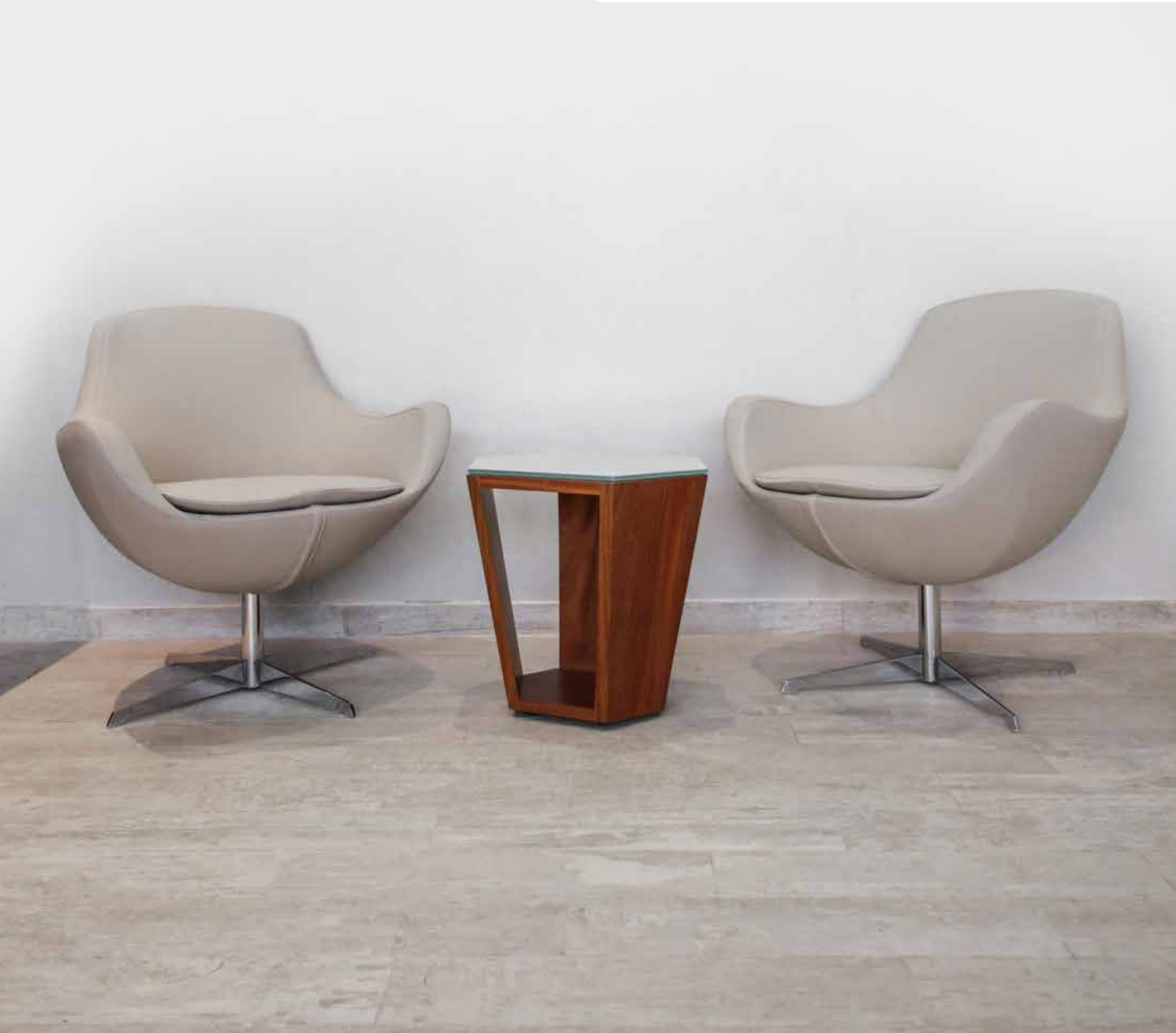
COURTYARD MARRIOTT / CD. DEL CARMEN